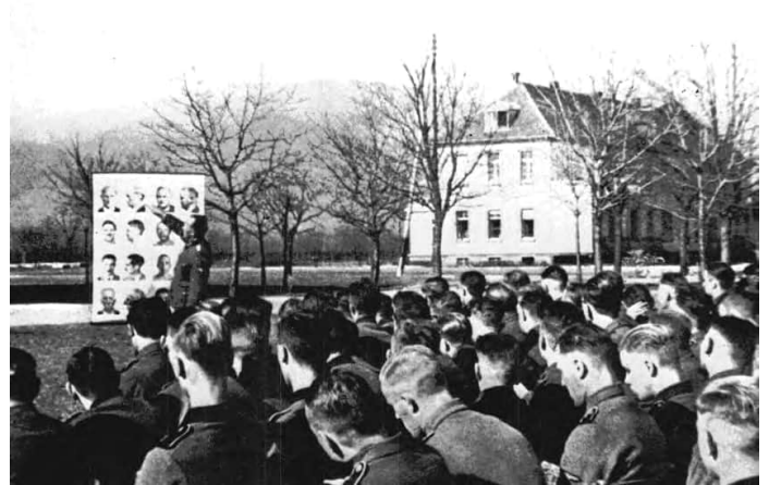
Die Freiwilligen der Waffen-SS, die aus allen europäischen Ländern kommen, müssen zwingend ein mehrmonatiges Praktikum im Ausbildungslager Sennheim im Elsass absolvieren. Dieses Praktikum dient viel mehr der körperlichen und politischen Auswahl als der militärischen Ausbildung. Der Tagesablauf besteht vor allem aus der Vorbereitung – in einem höllischen Tempo – auf die sportlichen „Olympiaden“, die jeden Samstag stattfinden. Die SS-Freiwilligen besuchen außerdem Kurse im Freien, in denen die Gesetze der Vererbung und der Eugenik vermittelt werden.