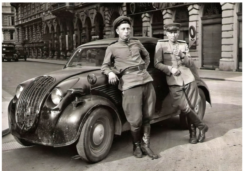
Ein Steyr Typ 50/55, der von der Roten Armee erbeutet wurde. Das Fahrzeug hat einen Scheinwerfer mit Notek-Tarnmuster – das bedeutet, dass es vor seiner Erbeutung bei der Wehrmacht im Einsatz war.

Heute sagt man, wir seien die Zerstörer der Kirchen gewesen, aber das stimmt nicht. Fast jeder Mann unter meinem Kommando war gläubig und kämpfte, um die Kirchen und unsere gemeinsame Kultur zu schützen. Die Russen sagten, wir hätten ihnen Kunstschatze gestohlen, aber das ist eine Lüge. Wenn überhaupt etwas mitgenommen wurde, dann nur, um es vor ihren Händen zu bewahren, um es zu retten. Ich weiß, dass die Deutschen das in ganz Europa taten: Gegenstände wurden zur Sicherung weggebracht, um nach den Kämpfen zurückgegeben zu werden. Ich habe keine Plünderungen durch unsere Männer gesehen, aber ich habe die Folgen der russischen Plünderungen festgestellt. Sie drangen in jede Stadt und jeden Ort ein und stahlen alles, was sie tragen konnten. Ich weiß, dass ich auf dem Weg in ein Lager in Russland einen Soldaten sah, der ein kunstvolles Gemälde trug, und seinen Kameraden mit einem schicken Plattenspieler. Ihnen wurde erlaubt, das zu tun, Europa zu plündern. Wir versuchten, die Polen zu schützen, aber als wir hörten, dass sie sich in Warschau erhoben hatten, betrachteten wir sie mit Misstrauen. Es gab einige Partisanenangriffe hinter den Linien, gegen die vorgegangen werden musste, was, wie ich hörte, brutal war.