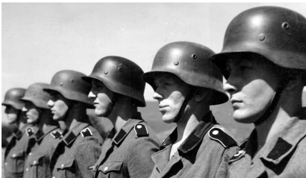
Französische Freiwillige der Waffen-SS bei der Ausbildung in Sennheim im Jahr 1943. Sennheim war das Ausbildungslager für normale Rekruten.